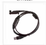
Cavo di programmazione USB PC152