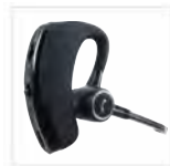
Auricolare BT con PTT EHW08