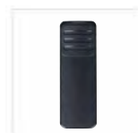
Clip per cintura BC48