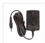
Alimentatore per CH10L27