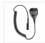
Microfono altoparlante remoto con pulsante di emergenza (IP67) SM26N1