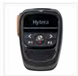
Microfono wireless SM27W2