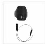
PTT wireless POA121