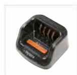
Caricabatterie rapido per batterie Li-Polymer/Li-Ion CH10L27