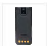
Batteria Li-Polymer BP2403