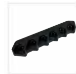
Caricabatterie a 6 posti, 2A, incluso alimentatore MCL39