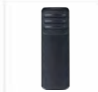
Clip per cintura BC48