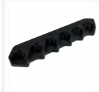
Caricabatterie a 6 porte, 2A, incluso alimentatore MCL39