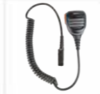
Microfono altoparlante remoto con pulsante di emergenza (IP67) SM26N1