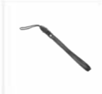
Laccetto da polso RO03