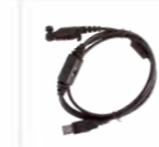
Cavo di programmazione USB PC152