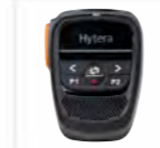
Microfono wireless SM27W2