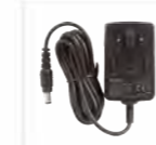
Alimentatore per CH10L27