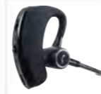
Auricolare BT con PTT EHW08