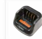
Caricabatterie rapido per batterie Li-Polymer/Li-Ion CH10L27