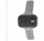
PTT wireless POA121