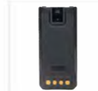
Batteria Li-Polymer BP2403