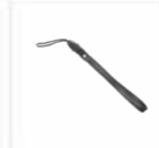
Laccetto da polso RO03