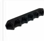
Caricabatterie a 6 posti, 2A, incluso alimentatore MCL39