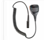
Microfono altoparlante remoto con pulsante di emergenza (IP67) SM26N1