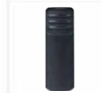
Clip per cintura BC48